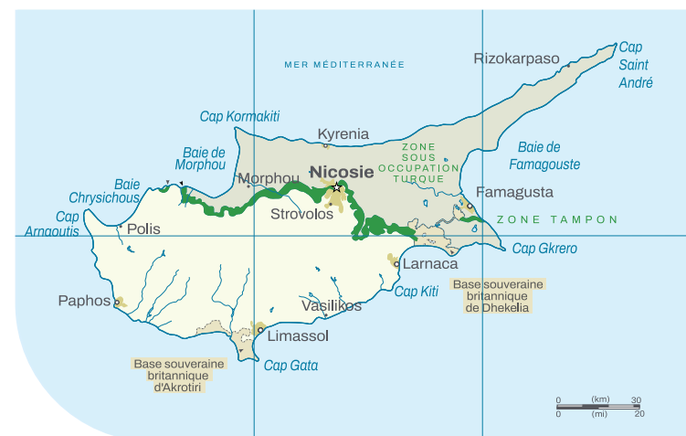
Carte de Chypre

Afin d'assurer cette maîtrise et d'instaurer la confiance nécessaire, la Commission européenne a sélectionné un organisme impartial et doté des compétences requises